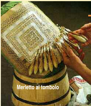
Merletto al tombolo